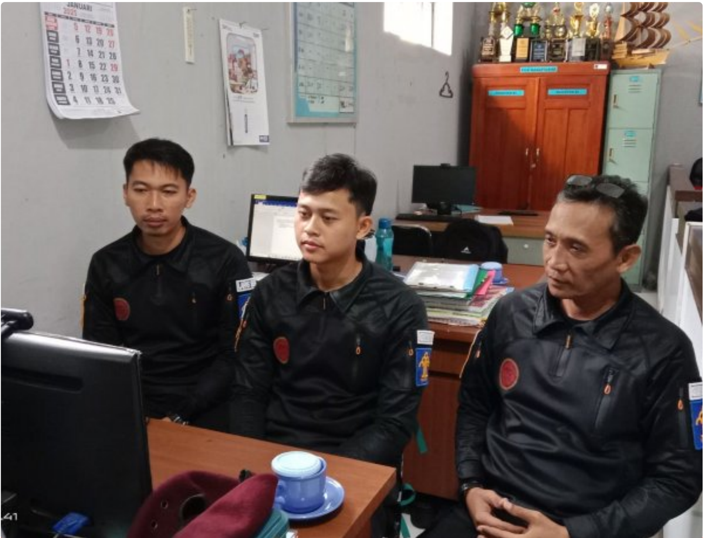
Bangun Harmoni dan Strategi, Lapas Besi Ikuti Webinar Refleksi Akhir Tahun 2024 & Resolusi 2025

CILACAP – Sebagai salah satu langkah dalam pengembangan kompetensi bagi